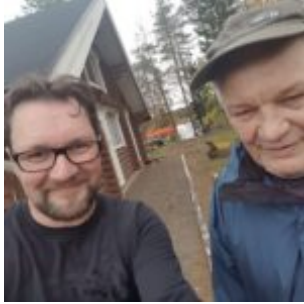
Lapiomiehen apumies, kuvassa vasemmalla?