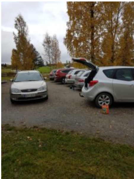
Talkooporukan autoja, ahkerista talkoolaisista ei meinannut kuvia saada kun olivat kaikki niin työn touhussa